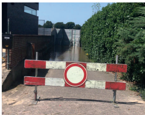
Vechten tegen de Maas, juli 2021

Gevaarlijke situaties of schademelding, bel:14077, mail: info@venlo.nl of gebruik de BuitenBeter app.