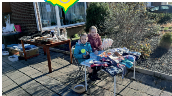
Belfeldse rommelroute, oktober 2021