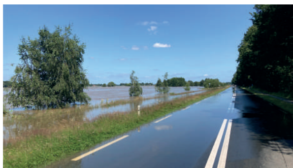
Rijksweg, juli 2021