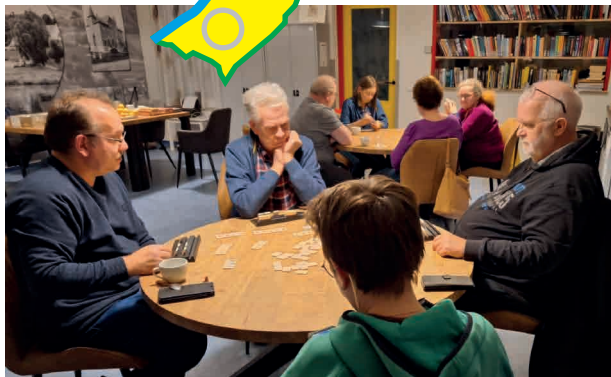
Spelletjes spelen in Steyl